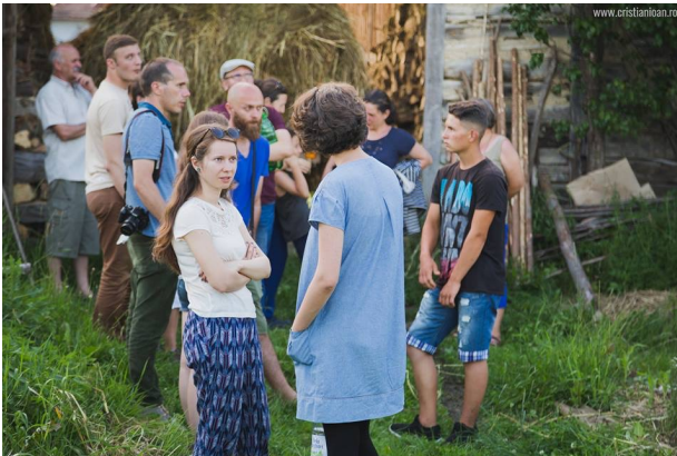
Module 4 du programme de formation Be Part of CSA! , en Roumanie, 2016.

Cette année, Urgenci et ses partenaires européens ont travaillé à trois projets dans le cadre du programme éducatif Erasmus +, qui promeut « la coopération pour l'innovation et l'échange de bonnes pratiques ». Nous aurons les résultats cet été.