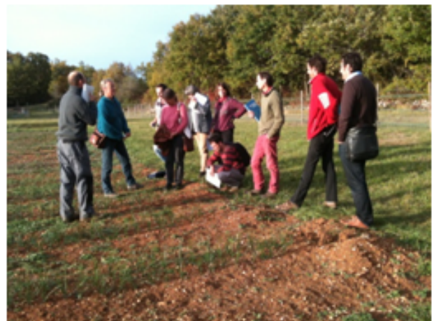
Formation aux Systèmes participatifs de garantie organisée par Nature et Progrès dans le Tarn, en France.

C'est à Beijing, en novembre 2015 lors du 6ème symposium d'Urgenci, que nous avons pour la première fois discuté d'un projet commun sur « Systèmes de garantie Participatifs et ASC » avec l'IFOAM. Les SPG ne constituent pas seulement une innovation en matière de certification; avant toute chose, il s'agit d'un puissant outil pédagogique. Les SPG permettent un apprentissage participatif qui élargit les horizons de chacun des participants, tous acteurs de la chaîne alimentaire, à différents niveaux: producteurs, consommateurs, bénévoles associatifs, commerçants, ONG. Les SPG, comme les CSA, établissent des partenariats sur le long terme fondés sur la confiance.