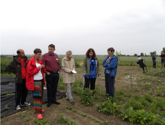
Module 4 de Be Part of CSA! en Rép. tchèque, 2016.

Les entreprises relevant de l'économie solidaire reposent sur un modèle de prise de décision démocratique et sur un système de gestion participative qui vise à assurer la responsabilité collective.